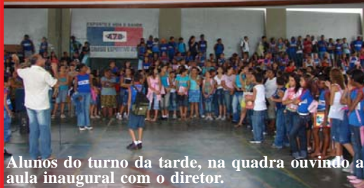
Alunos do turno da tarde, na quadra ouvindo a aula inaugural com o diretor.